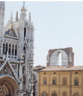
IL DUOMO E IL FACCIATONE

In Piazza del Duomo sorge la Cattedrale romanico-gotica dove sono custodite opere dei più grandi scultori italiani da Nicola Pisano a Gianlorenzo Bernini. Altri tesori artistici, che un tempo arricchivano l'edificio sacro, trovano oggi collocazione nelle sale del Museo dell'Opera del Duomo . Tra gli altri capolavori, vi si conservano le statue marmoree di Giovanni Pisano che abbellivano la facciata