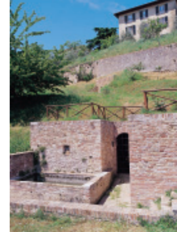
FONTE DELLE MONACHE

appartato per permettere alle monache di clausura di lavare i panni senza essere viste.