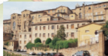
IL FOSSO DI SANT'ANSANO

Siena divennero oggetto delle prese in giro delle città vicine. Una targa posta all'inizio della strada cita le parole con cui Dante descrisse la situazione: "Tu li vedrai tra quella gente vana/ che spera in Talamone, e perderagli/ più di speranza ch'ha trovar la Diana". Proseguiamo per Via San Marco finché giungiamo all'omonima Porta, costruita nella seconda metà del Duecento. L'arco al di sopra del portone è un accorgimento tipico di