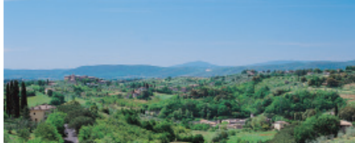
VISTA PANORAMICA DA VIA DELLE SPERANDIE

Usciamo da Piazza del Duomo da Via dei Fusari e giriamo a sinistra nel Vicolo di San Girolamo , una stradina stretta e ripida, quasi nascosta, che precipita, silenziosa, in Piazzetta della Selva . Procediamo lungo Via del Fosso di Sant'Ansano . Il nome della strada ricorda il luogo dove, secondo la leggenda, il Santo Patrono di Siena sarebbe scampato miracolosamente al martirio. Infatti si narra che Ansano, condannato a morte per essersi rifiutato di adorare gli dei pagani, uscì illeso da una caldaia d'olio bollente. Il proconsole romano Lisia decretò allora la morte per decapitazione. Ansano morì a Dofana il 1 Dicembre 303. Nei punti dove rimbalzò la testa del martire sgorgarono sorgenti d'acqua.